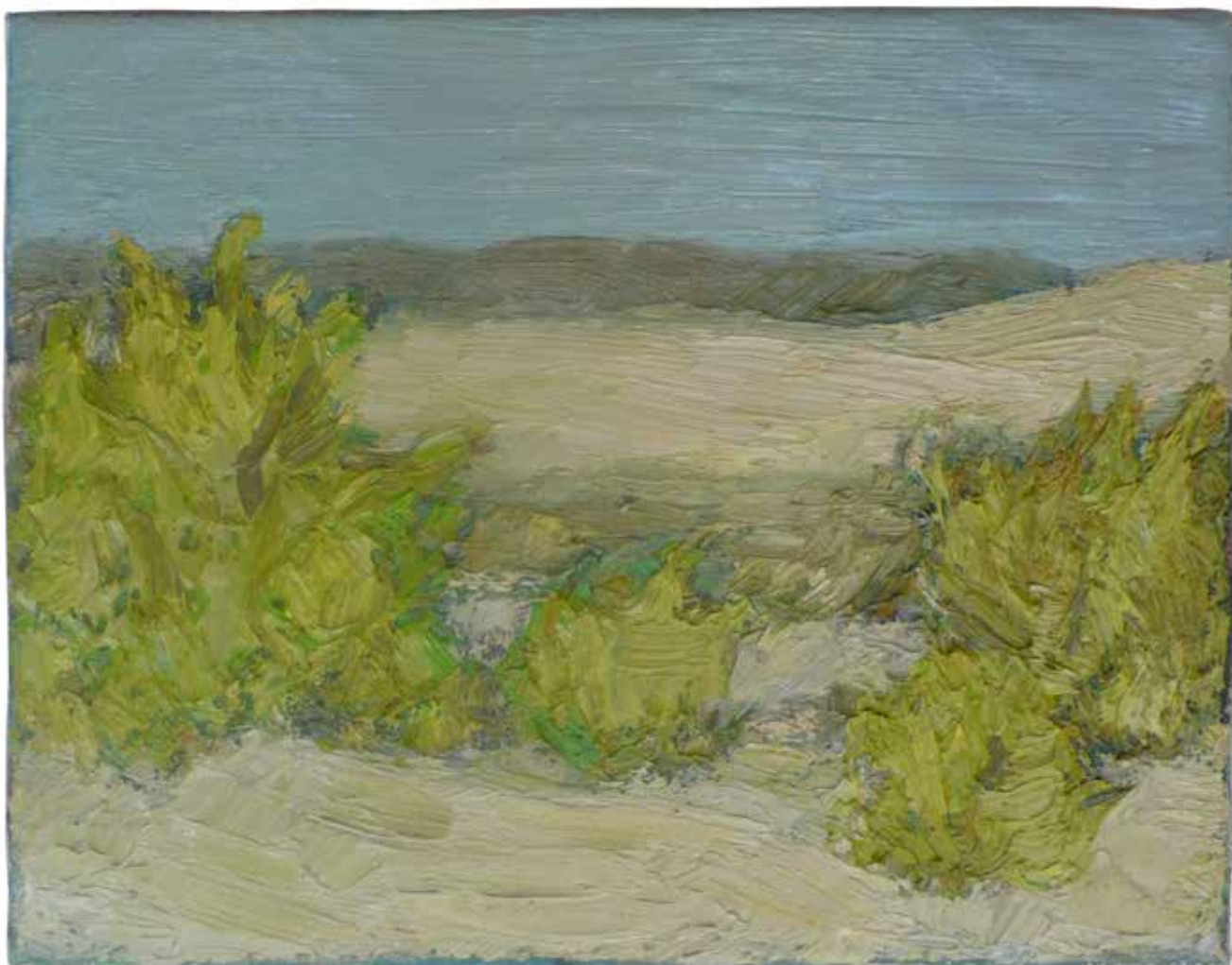
8 vue vers Campestre 18 cm x 25 cm huile sur toile 2015