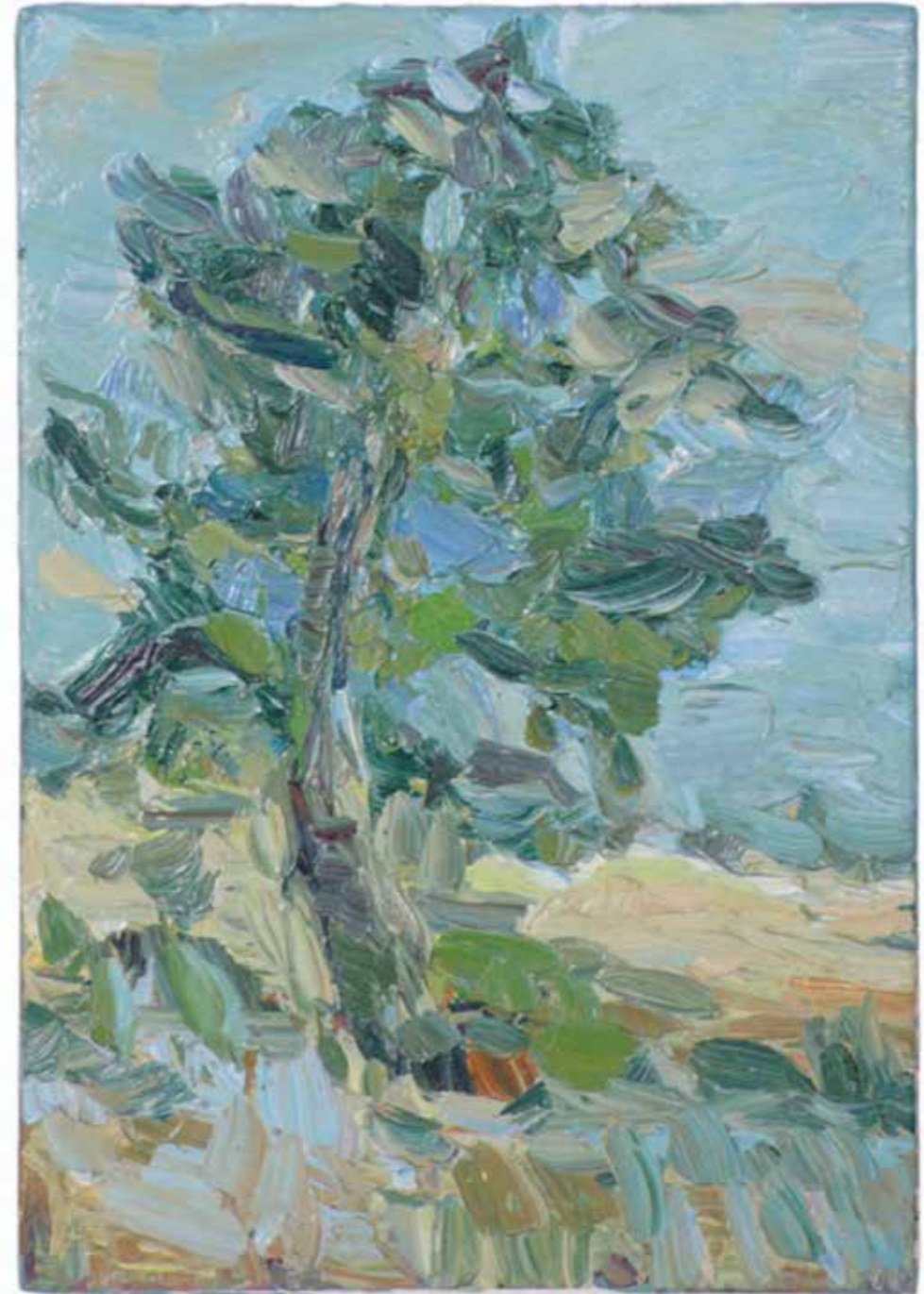
10 arbre 28cm x 20cm huile sur toile 1997