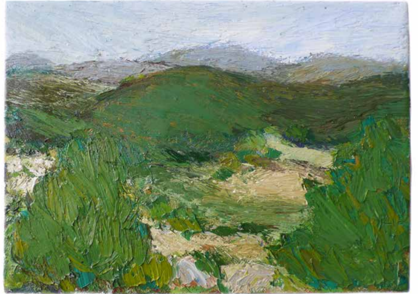
3 casse II 19cm x 27cm huile sur toile 2012