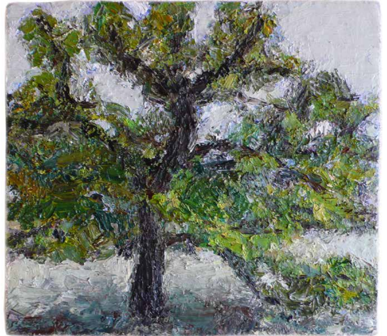
15 chêne 28cm x 31 cm huile sur toile 2010