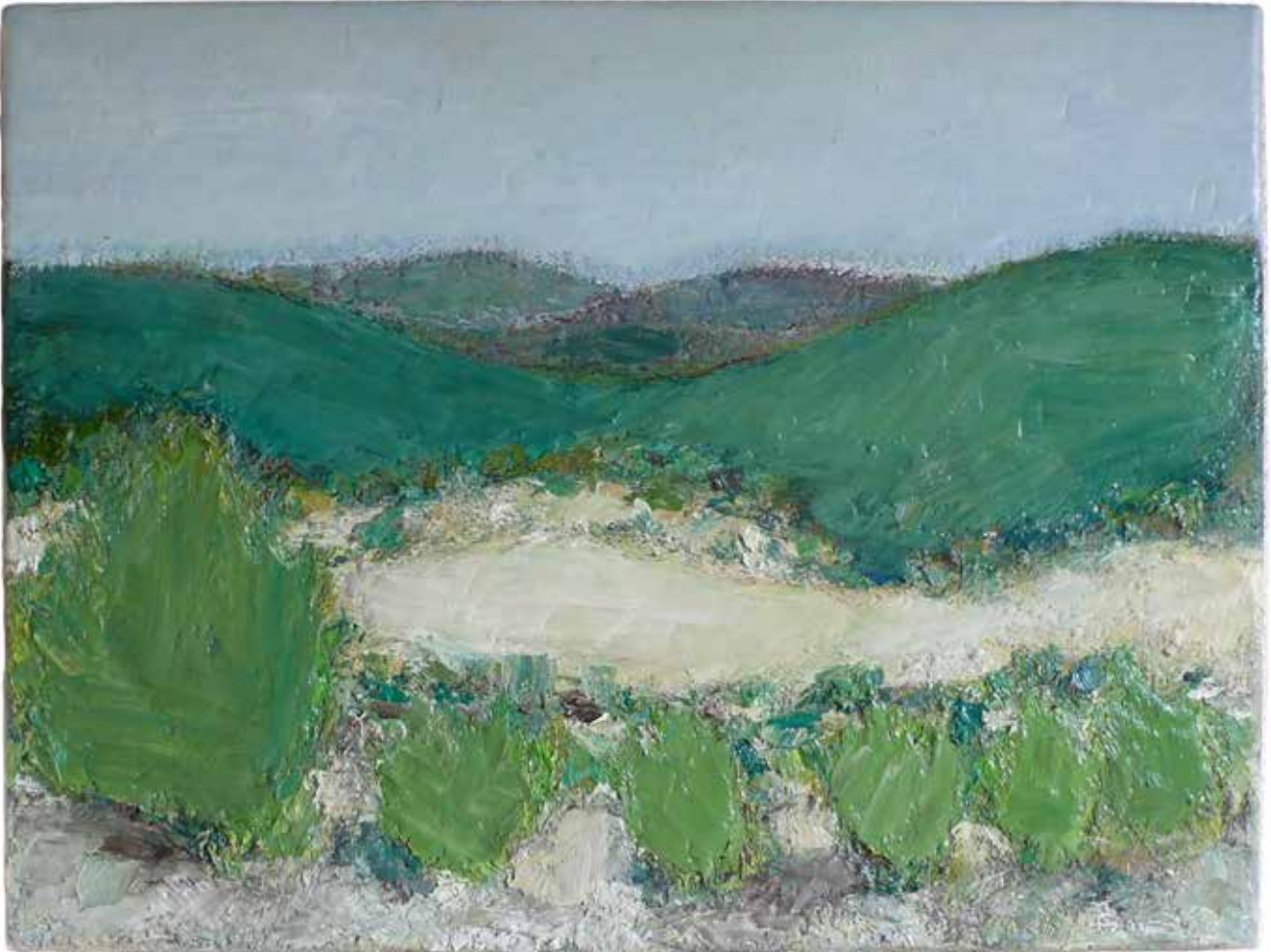
5 cause 35 cm x 45 cm huile sur toile 2013