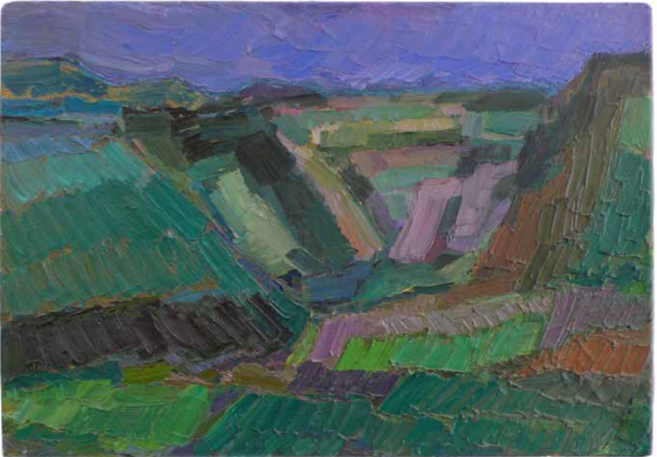
11 falaise 30 cm x 43 cm huile sur toile 1990