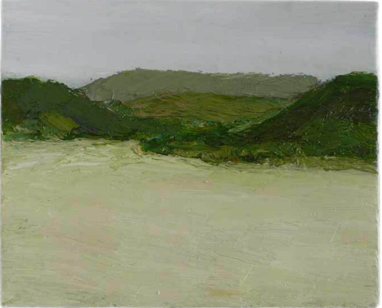
2 vue du jardin 23 cm x 29 cm huile sur toile 2010