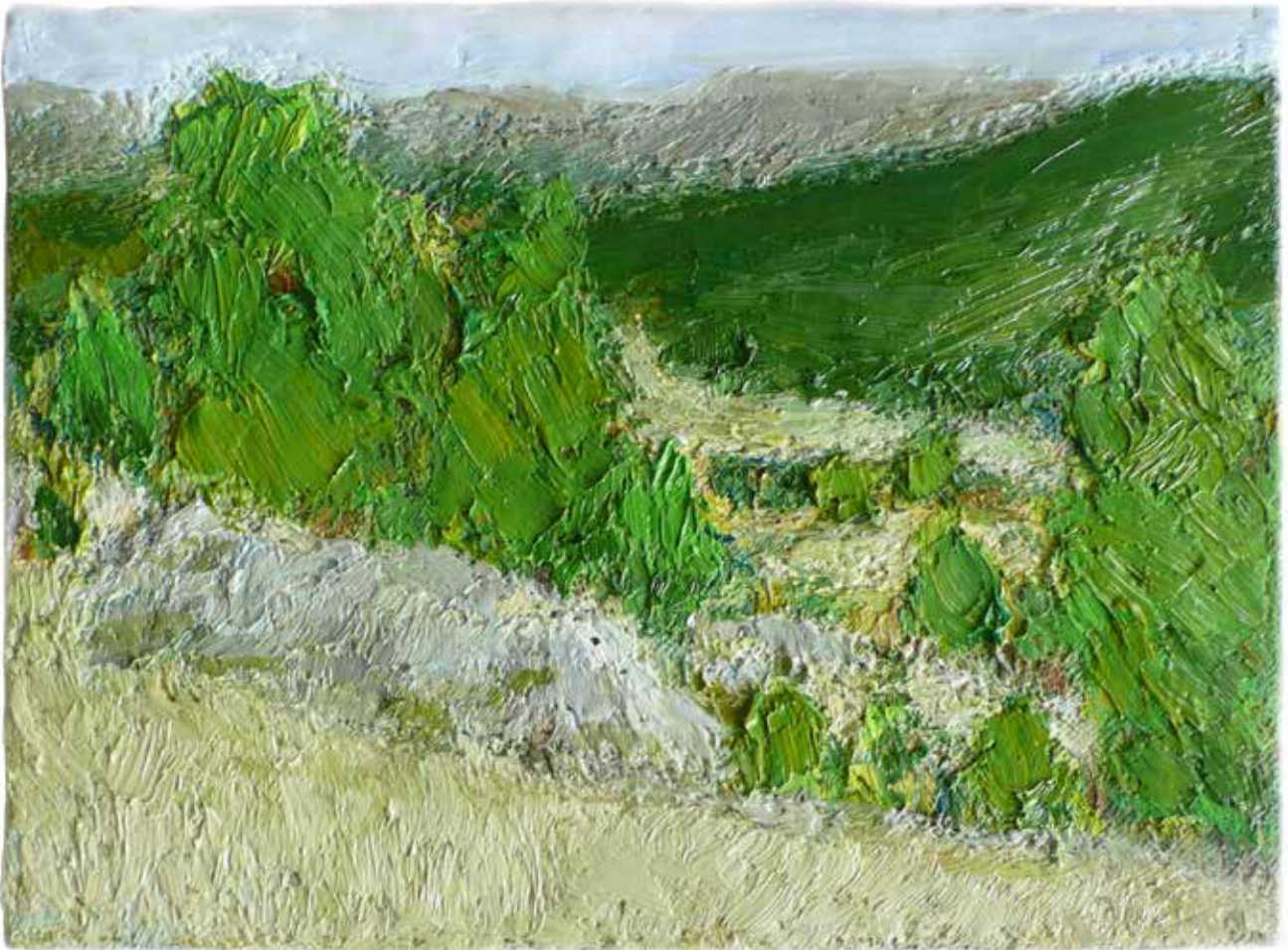
6 casse I 19 cm x 27 cm huile sur toile 2012