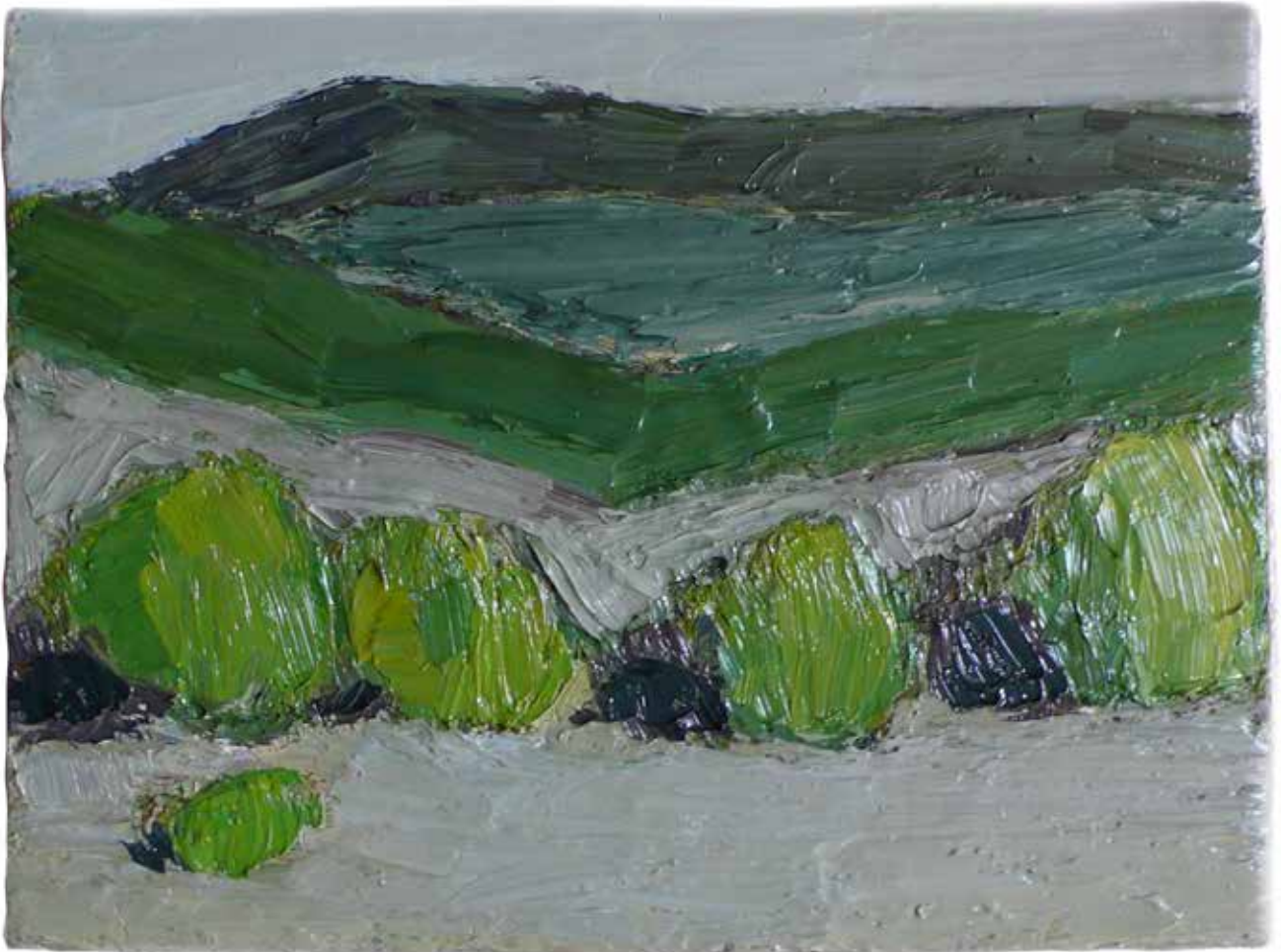
7 arbustes sur le causse 28 cm x 35 cm huile sur toile 2011