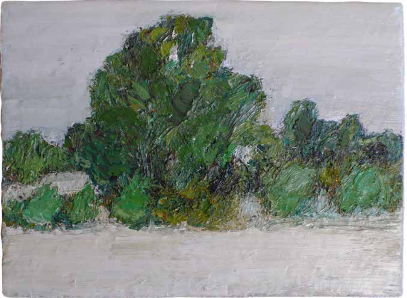
9 buissons 27 cm x 40 cm huile sur toile 2010